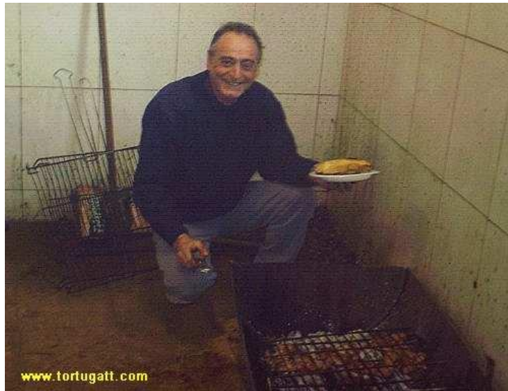
Fulletortuga - 2005