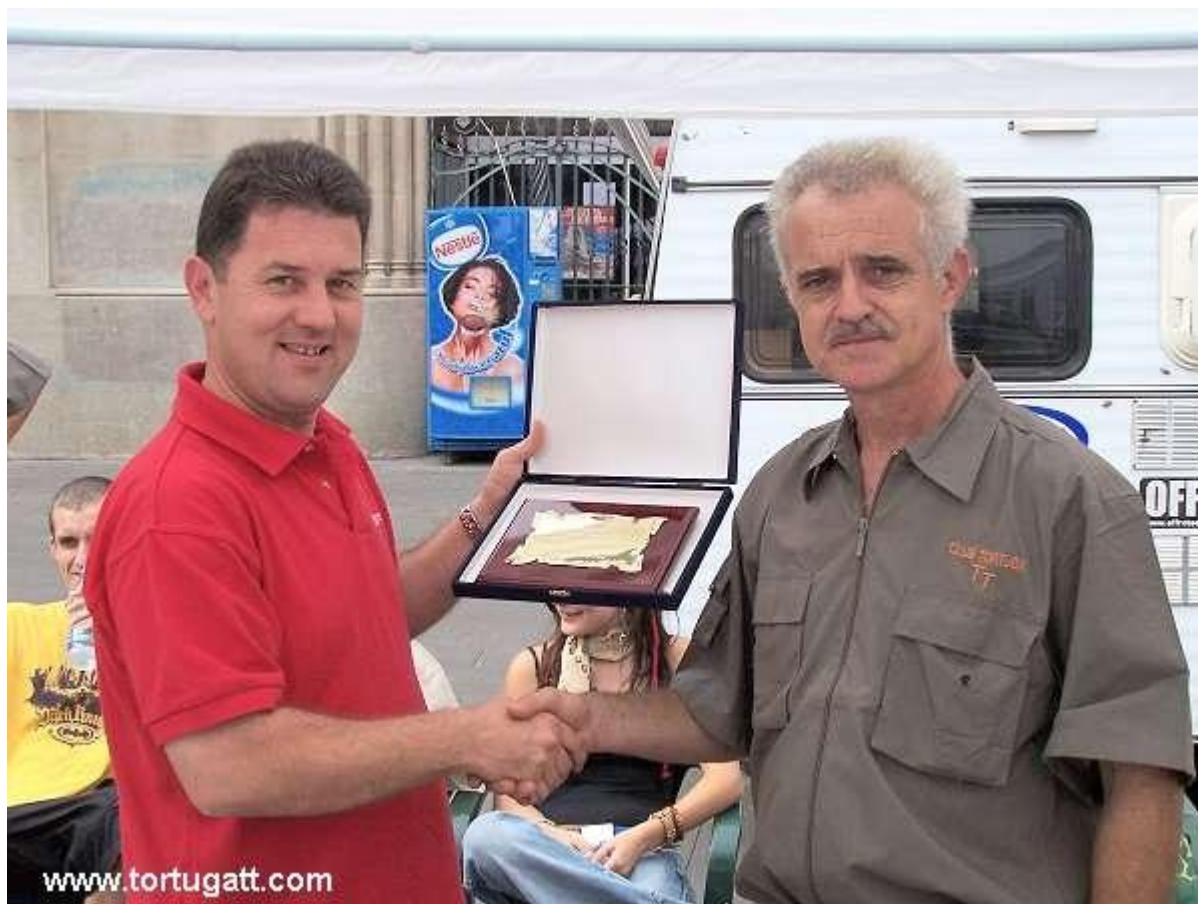
Fulletortuga - 2005

Finalizada la entrega de premios realizada por Sr. Claudio de Toyota Autoforum. Le hicimos entrega al mismo de una placa en agradecimiento a su colaboración en esta primera prueba de Gyncama 4x4.