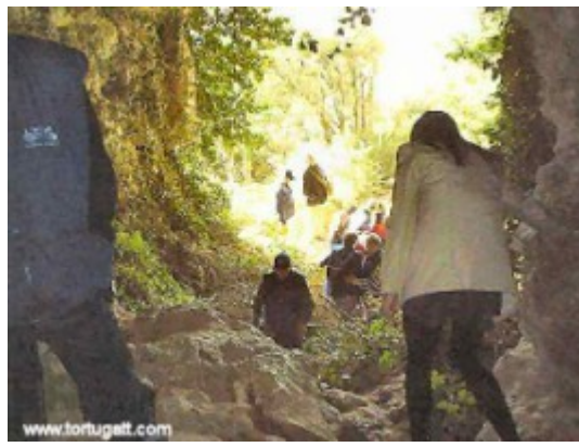
Font de la Escudelleta